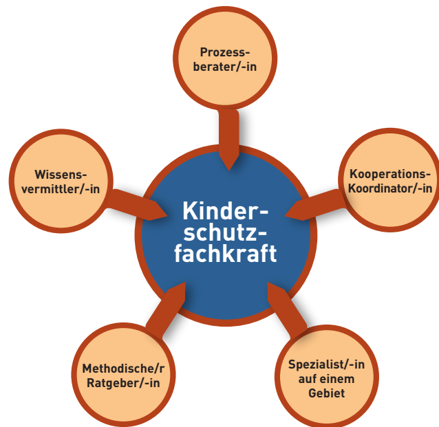
Abbildung 3: Ein „Idealprofil“ der Kinderschutzfachkraft

(1) Eine Kinderschutzfachkraft zeichnet sich zunächst durch Wissenskompetenz im Kinderschutz aus, welche sie im Verfahren nicht nur zur Beurteilung einer objektiven Gefährdungslage einbringt. Vielmehr ist die Kinderschutzfachkraft im Kontakt mit der fallzuständigen Fachkraft aufgefordert, ihr/ihm spezifisches Fachwissen so weiterzugeben, dass es im unmittelbaren Umgang mit dem betroffenen Fall dienlich ist. Handelt es sich beispielsweise um eine Familie mit psychischen Erkrankungen, so ist im Umgang mit der Familie ein anderes Vorgehen erforderlich als bei einer Familie, in der es Verdachtsmomente eines sexuellen Missbrauchs gibt. Insofern sind zum einen die jeweils spezifischen Fach- und Interventionskenntnisse der Kinderschutzfachkraft erforderlich und zum anderen aber auch ihre Fähigkeit, diese Kompetenz an die/den zuständigen Mitarbeiter/in wertschätzend zu vermitteln. Die fallzuständige Fachkraft