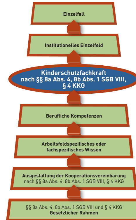
Abbildung 2: Bestimmung des Einsatzfeldes einer Kinderschutzzfachkraft