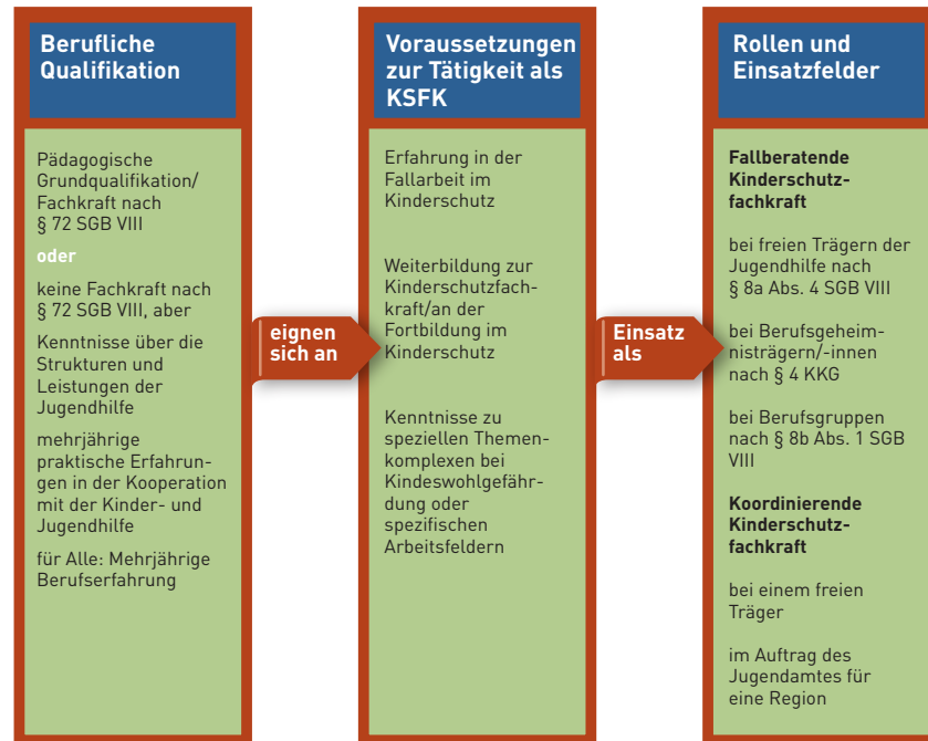
Abbildung 1: Qualifikation und Einsatzfelder der Kinderschutzzfachkräfte (KSFK)

Kinderschutzzfachkräfte außerhalb der Jugendhilfe können den Beratungsanspruch nach den §§ 8a Abs. 4 und 8b Abs. 1 SGB VIII nur erfüllen, wenn sie hierzu generell oder im Einzelfall das Einverständnis des zuständigen Jugendamtes erhalten. Dabei muss sichergestellt sein, dass sie die Expertise der Jugendhilfe (z.B. in Form einer Kinderschutzzfachkraft als Tandempartnerin aus dem Feld der Jugendhilfe) in die Beratung miteinbeziehen (vgl. Tandem-Modell unter Punkt 1.4).