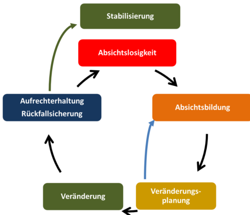
Abbildung 2: Das transtheoretische Modell der Verhaltensänderungen nach Prochaska und DiClemente

Mit Blick auf eine veränderungsbezogene Kommunikation haben Miller und Rollnick das transtheoretische Modell der Verhaltensänderungen von Prochaska und DiClemente (vgl. DiClemente u.a., 1991) in ihren Ansatz integriert. Das Konzept von Prochaska und DiClemente ist in Abbildung 2 skizziert und beschreibt unterschiedliche Stadien individueller Veränderungsprozesse. Darüber hinaus werden für die einzelnen Stadien jeweils geeignete pädagogische oder beraterische Interventionen vorgeschlagen. Dieses Modell erscheint mir sehr hilfreich, weil es erklärt, warum bestimmte grundsätzlich gute Beratungsmethoden in bestimmten Situationen zwecklos oder sogar kontraproduktiv sein können. Die Integration dieses transtheoretischen Modells war für mich einer der Gründe, warum ich mich für MI entschied und mehr darüber lernen wollte.